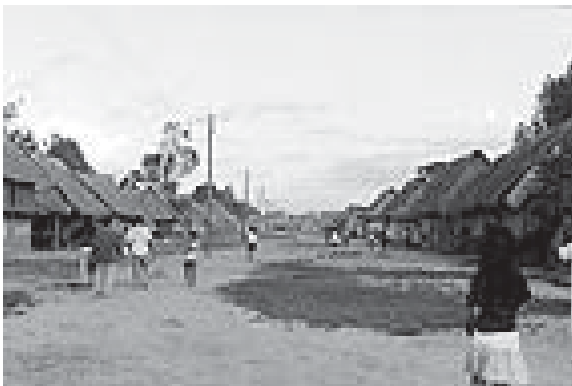
Bild från byn där aktionen den 2 oktober genomfördes

I samband med detta rapporteras att en liknande aktion genomfördes