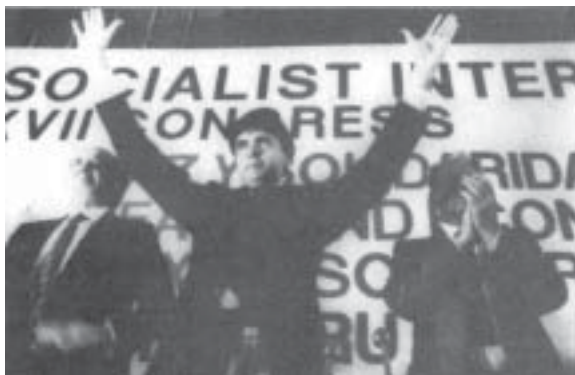
F.d. presidenten och APRA-mannen Alan Garcia under socialistinternationalens möte i Lima 1986.