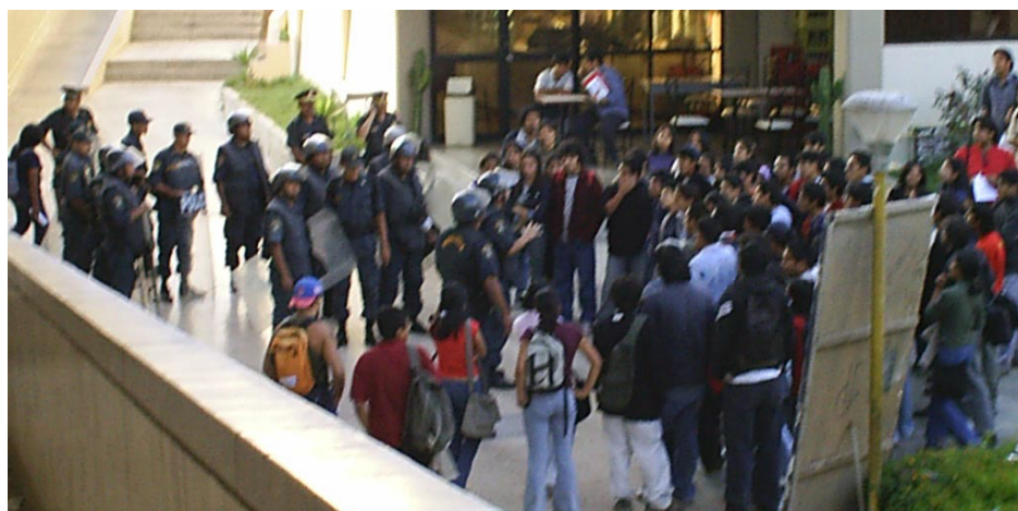
Polisen stormar San Marcos universitetet på jakt efter kamrater.

Försvaret av Ordförande Gonzalos liv har under det gångna året förts fram över hela världen, och under den internationella aktionsdagen till försvar av hans liv, initierad av MPP (Folkrörelsen Peru), genomfördes manifestationer, möten, demonstrationer, flygbladsutdelningar, aktioner etc. på en mängd platser över hela jorden, från USA till Bangladesh. I Sverige genomfördes aktionsdagen av VfsNP med manifestationer i Stockholm, Malmö, Uppsala, Lund, Södertälje och Helsingborg, och sammanlagt 20 000 flygblad delades ut (se sidan 47 - 49 för mer information). Dock får vi inte slå oss till ro med den seger detta betydde, utan fortsätta att utveckla världskampanjen för försvaret av Ordförande Gonzalos liv, som anfö-