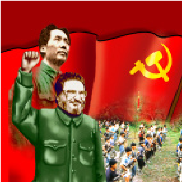
Ordförande Gonzalo har etablerat maosismen, som ny, tredje och högre etapp av marxismen.

nya folkmord, för det är den enda väg de känner.