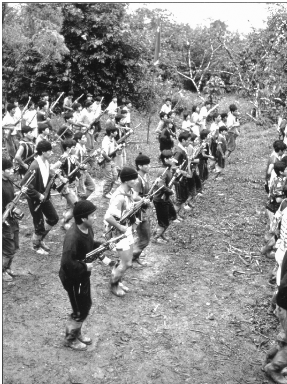
Kamraterna i Folkets Befrielsearmé besegrade under slutet av 2004 reaktionens blodrypande horders kampanj mot de revolutionära stödbaserna i Ene- och Tamboflodens dalgångar.