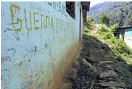
Talaboso, efter att FBA intagit staden

med ”250 miljoner dollar”, osv. osv. Men än en gång så är massornas förtroende för Partiet orubbligt, och det spelar ingen roll att de försöker förvanska verkligheten, såsom uttrycks i La Republica 25 juni 2004; ”de bosättare som sysslar med odling av kokablad,