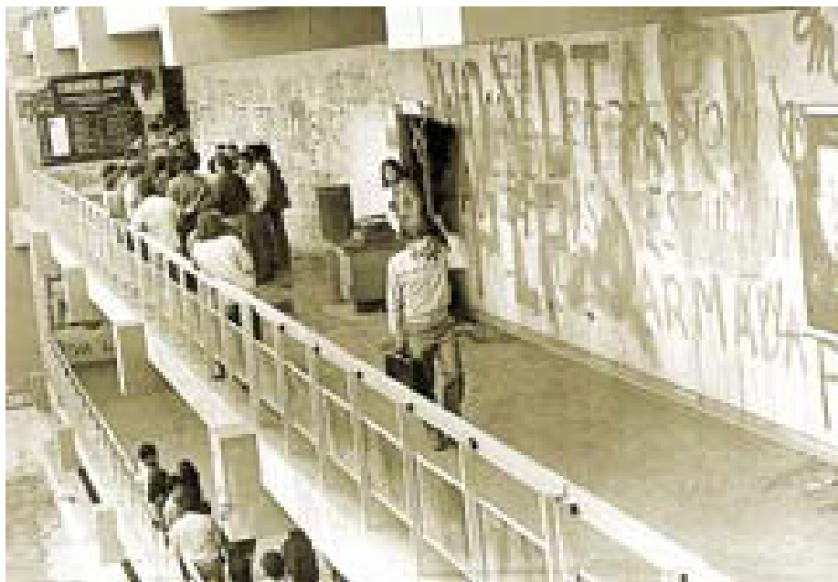
San Marcos universitetet i Lima under 80-talet. Partiets slagord på väggen lyder: NO VOTAR! PCP, på svenska RÖSTA INTE! PKP.