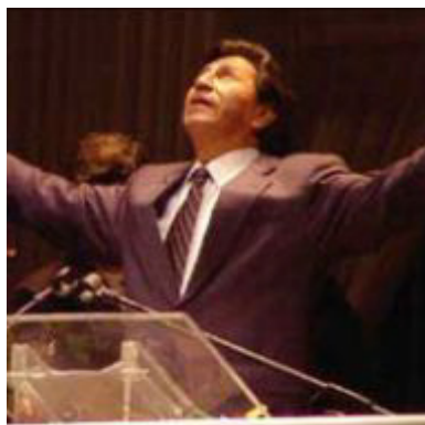
Toledo åkallar herren

Den gamla världsordningen skakas av kriser, kaos och krig på alla kontinenter, så också i Peru där folkkriget avancerar mot maktens erövring i hela landet, som en ledfynd för världens proletariat och folk. Toledos regering fortsätter samma politik som den fört tidigare, den politik den övertog från den avsatta Fujimorire-