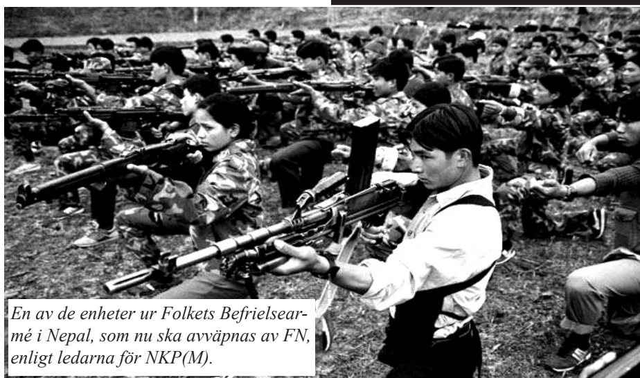
En av de enheter ur Folkets Befrielsearmé i Nepal, som nu ska avvärpnas av FN, enligt ledarna för NKP(M).