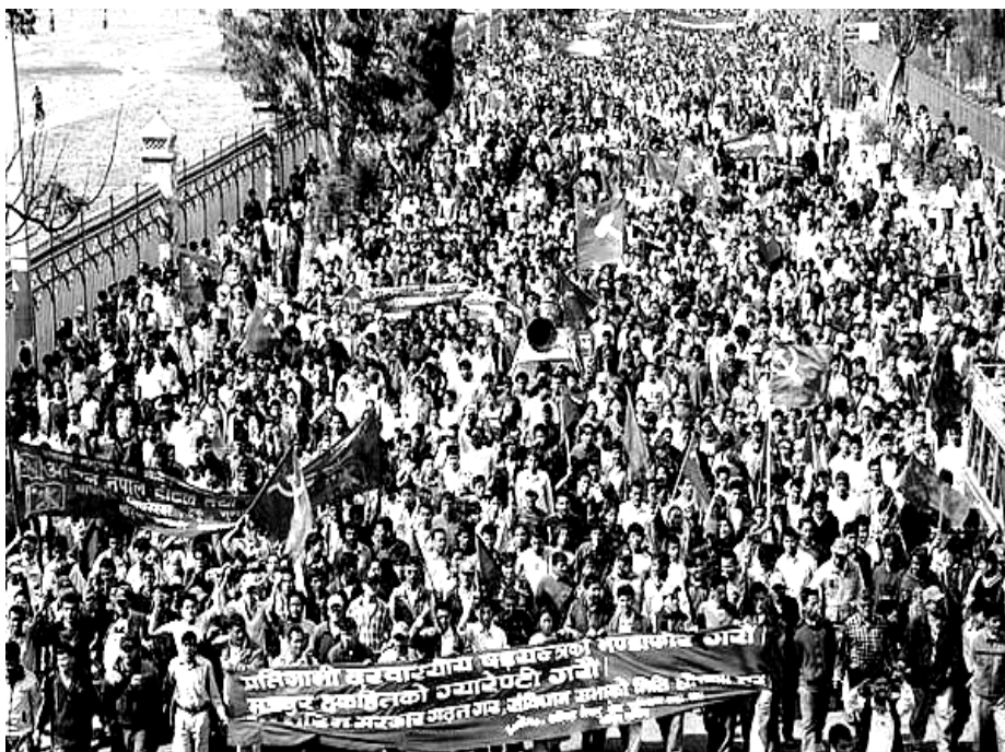
Fortfarande behåller NKP(M) ett stort stöd bland massorna, men hela detta stöd har varit baserat på att de har varit de som garanterat massornas intressen genom folkkrig. Här en demonstration av hotell- och restauranganställda under NKP(M)s ledning, 21 mars 2007.

Föreningen Ny-demokrati Tyskland, februari 2007