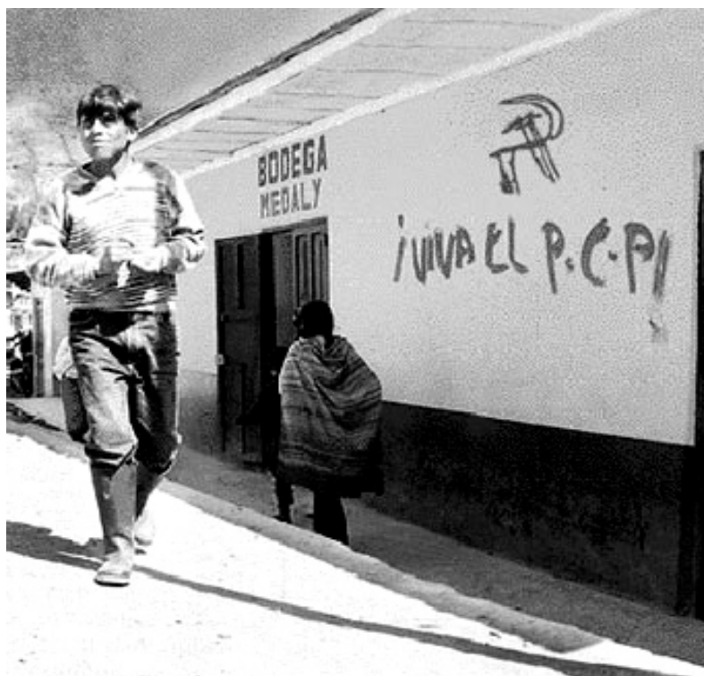
Väggmålning i Ayacucho

Huancavelica - Tayacaja Mer än tio kamrater skjuter sönder en militärpolisbil. Minst en militärpolis tillintetgörs.