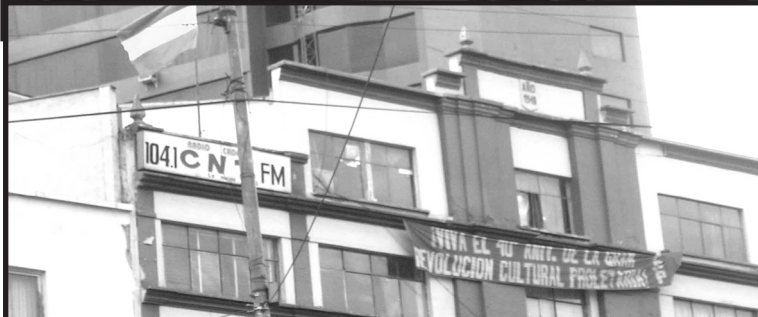
Ovan: Banderoll i ett folkligt område i La Paz, Bolivia: LEVE DEN 40:e ÅRS DAGEN AV DEN STORA PROLETÄRA KULTURREVOLUTIONEN!