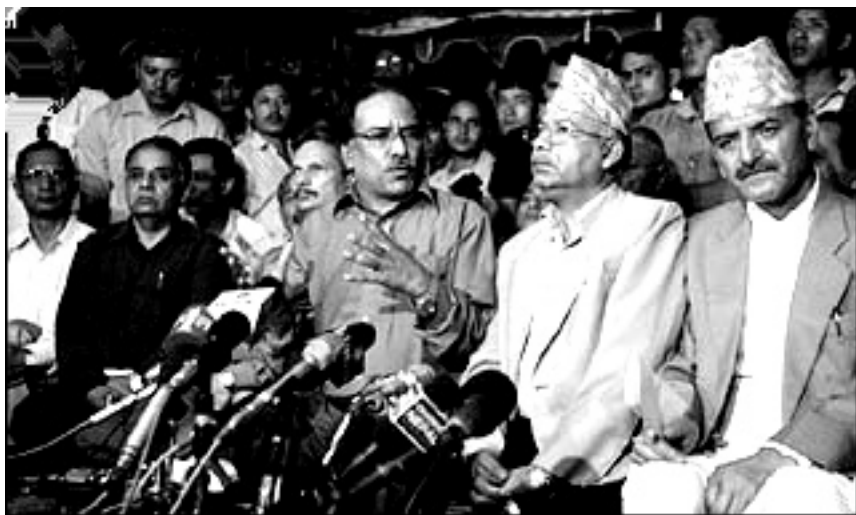
Kamrat Prachanda (i mitten utan mössa) tillsammans med allehanda reaktionärer och revisionister på en presskonferens.

dess helhet så uttrycker de en helgjuten strukturerad linje. Fallet är inte att kamraterna från Nepal lägger fram "en egen version", "en specifik väg" eller något åt det hållet, av marximen-leninismen-maoismen, utan det är något annat, något kvalitativt annorlunda. Således, då varje sak i ett klassamhälle kommer med en klasstämpel och i högsta grad då den politiska linjen hos ett politiskt parti inte är något annat än tillämpningen i klasskampen av den ideologi som vägleder det, vad som då måste preciseras är med vilken klass, med vilken ideologi NKP(M):s politik överensstämmer.