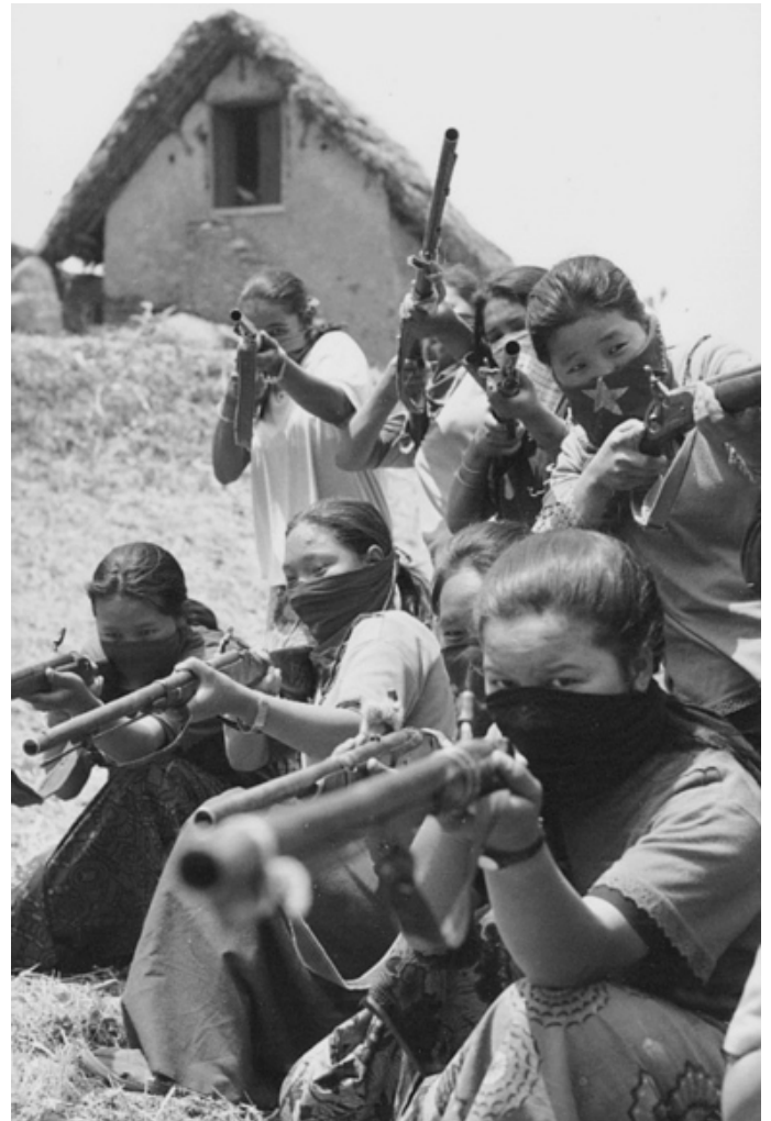
Kvinnor ur folkmilisen i Nepal, som även denna ska avväpnas och kvinnorna tvingas tillbaka att slava under godsherrarnas piska.

Självklart kan de påpekade punkterna, låt så vara, var för sig ses som isolerade ståndpunkter, men när man ser