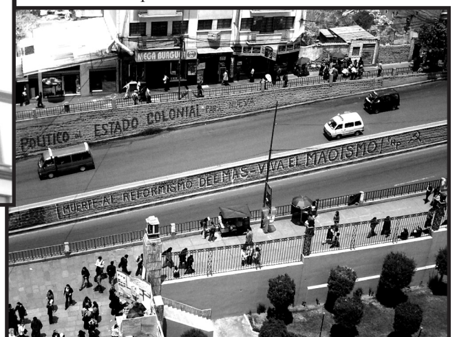
Till höger målning i samma stad: DÖD ÅT MAS' REFORMISM! LEVE MAOISMEN! (MAS är Evo Morales styrande parti)