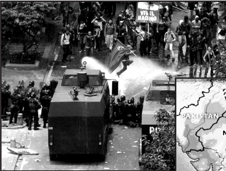
Till vänster: under Bushs besök i Colombia, 070311, demonstration under slagordet: LEVE MAOISMEN!