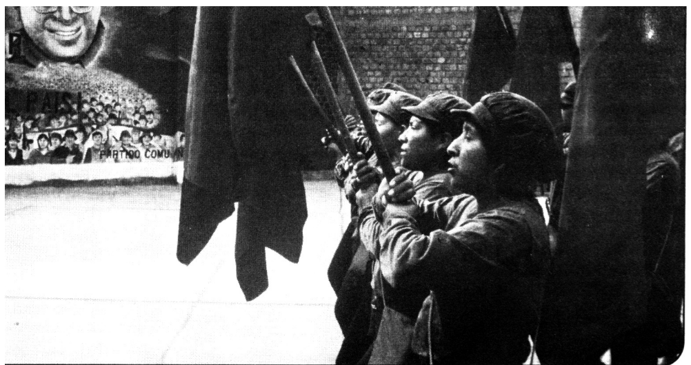
Kvinnliga krigsfångar och politiska fångar från Perus Kommunistiska Parti genomför firande i fångelserna, vilka de förvandlat till lysande skyttegravar av kamp.

ut kunna utvecklas som individer i ett kollektiv som inte är bundet till klasser eller kön. Därför tar vi avstånd från paroller som ”klasskamp, kvinnokamp”. Proletariatet kan inte kämpa för kommunismen utan att också kämpa för kvinnans frigörelse, varför då separera något som utgör en helhet. Det socialistiska Kina (till 1976) utgör för oss ett exempel, liksom det socialistiska Sovjetunionen (till 1956), på hur den proletära staten och det Kommunistiska Partiet, genom att mobilisera massornas oerhörda skaparkraft aktivt drar in kvinnorna i klasskampen och i kampen för produktionen. Med utgångspunkt från en industrialiseringsgrad jämförbar med de allra fattigaste