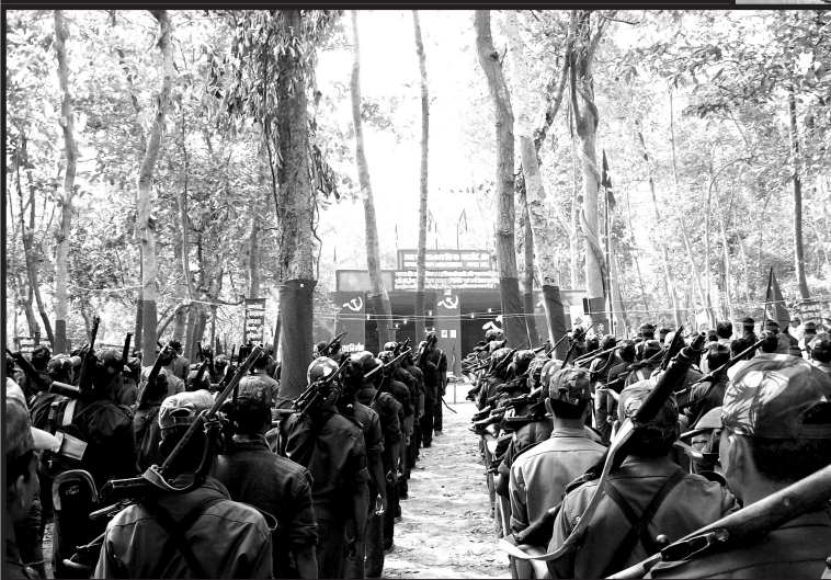
Ovan: Den s.k. "röda korridoren" där den väpnade kampen i Indien är som starkast.