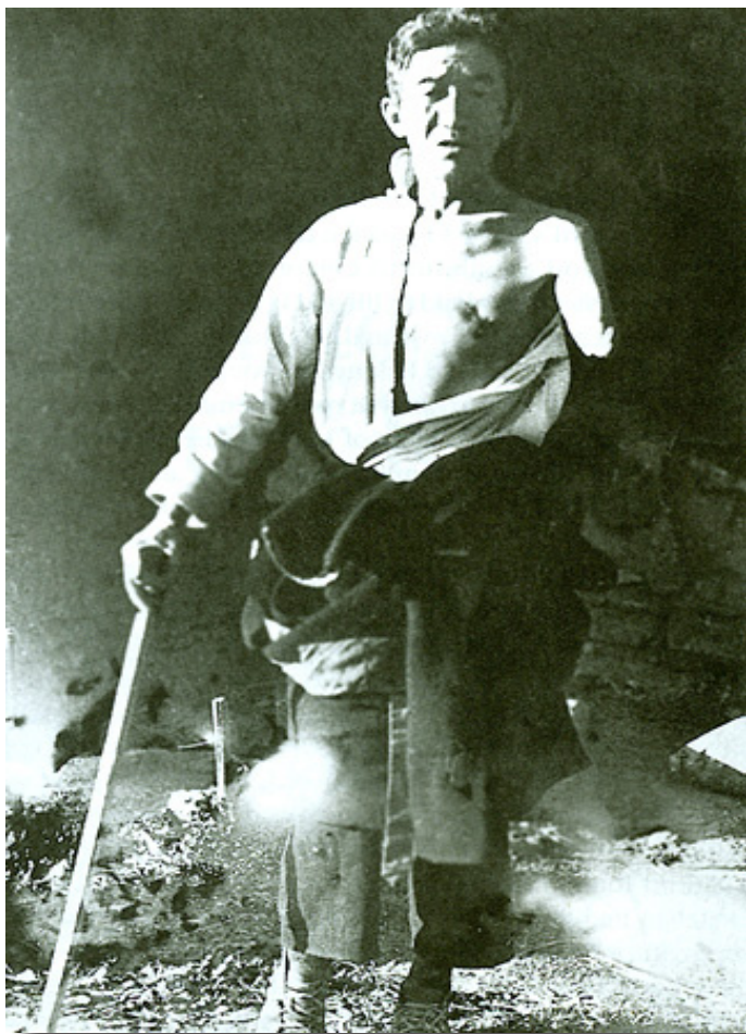
F.d. livegen som fått sin arm stympad av sin ägare.

berg (en god lama får inte själv mörda så de lät "berget" göra jobbet istället) osv. Det bör även påtalas att ipp emot 1/4 av alla tibetanska män blev munkar (de flesta blev undertryckta fattigmunkar och rangen berodde på ens klassursprung), och att resten av folket därför måste arbeta både för sin egen överlevnad och för denna kolossala mängd ickeproduktiva munkarnas försörjning, som dessutom fordrade enorma kvantiteter av exempelvis jaksmör för tempelbelysning, rökelse och andra "heliga" ting. Som om det inte var nog med detta så fanns det religiösa påbud om att "marken är helgad" och man kunde följaktligen inte plöja jorden mer än 10 cm djupt för att inte "störa jordandarna", eller att det var förbjudet att nyttja hjulet i annat syfte än som bönehjul.