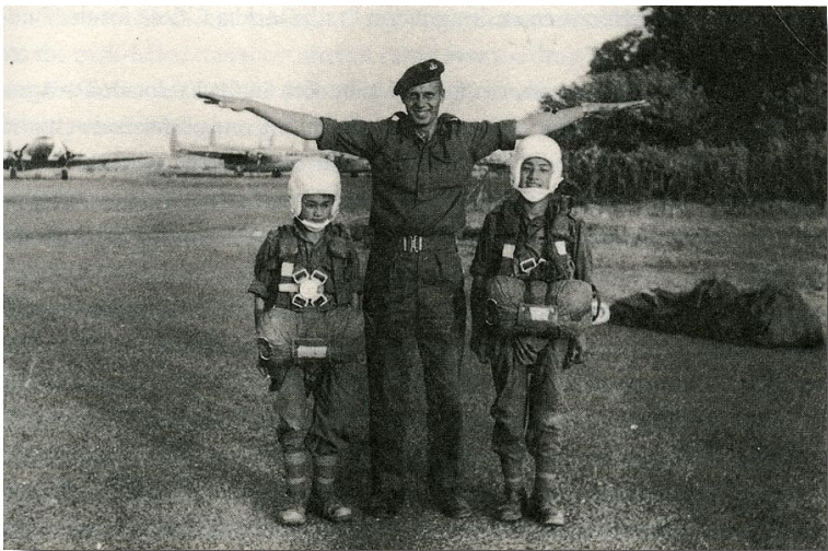
CIA-agent med tibetaner.

tatur samt krossade det feodala produktionssättet, den feodala ideologin och den feodala politiken i hela Kina . På grund av Tibets säregenhet så gick kommunisterna mycket långsamt fram i både den demokratiska revolutionen och det socialistiska uppbygget. 1959 hade dessa före detta härskande gurus fått nog av ”pöbelvälde”, och med stöd och direktiv från CIA (ett stöd de ”neutrala” lamorna försökt förneka i flera decennier) iscensatte ett uppror mot socialismen, ett uppror som resolut slogs ner av Folkets Befrielsearmé med stöd av det tibetanska folket . Efter detta smet Dalai lama-klickens hals över huvud till Indien och bosatte sig i staden Dharamsala i en flykt koordinerad av CIA över radio och med militärt understöd. Vid gränsen träffade Dalai Lama amerikanska agenter och de höll möte med honom.