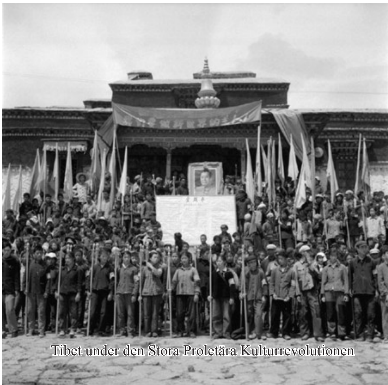
Tibet under den Stora Proletära Kulturrevolutionen

”Revisionismen har redan förlorat spelet, resten är bara en tidsfråga. Problemet är redan definierat, avfallet har redan börjat sopas bort och brännas; jag upprepar, det är en tidsfråga. De började redan förlora spelet för många år sedan. Om vi går längre tillbaks, till början, förlorade de spelet i det ögonblick då de blev revisionister, därför att spelet förloras då man överger principerna” (Ur Intervjun med Ordförande Gonzalo).