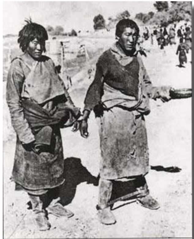
Tibetanska livegna innan befrielsen, fastkedjade med varandra och kring benen.

De som talar om ett "fritt Tibet", vad vill de egentligen? Vad innebär det? Ett sådant "fritt" Tibet, avskilt från Kina, kontrollerat av yankee-imperialismen och med de "heliga" munkarna som marionetter i någon slags "taliban-Kosovo", skulle givetvis inte vara "fritt". För att förstå frågan om Tibet och dess frihet eller icke-frihet, låt oss gå tillbaka några århundraden. Hurdant var detta tibetanska präststyre? I grunden var det naturligtvis väldigt likt alla andra feodala system, och hade säregenheten att det dessutom var en teokrati. Här behövs det klargöras en sak. Världshistorien har genomgått ett antal stadier från det att människan tog sina första fotsteg tills idag och framåt: ursamhället, slavsamhället, feodalismen, kapitalismen, (och imperialismen som kapitalismens sista stadium) för att sedermera fortsätta till socialismen och kommunismen. Det har naturligtvis sett lite olika ut i olika delar av världen. I Kommunistiska manifes-