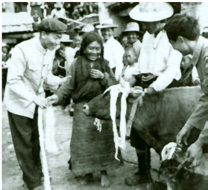
Bönderna fick både mark och boskap vid jordreformen, något som gjorde lamor och adel ursinniga.

När Folkets Befrielsearmé gick in i Tibet 1950, som del av hela Kinas befrielse, så tyckte de "tre stora herrarna" att det inte var något konstigt. De var vana vid 700 år av kinesisk myndighet, och t.o.m. i ceremonier bugade de sig inför porträtt (sedan 1900-talet fotografier) av de styrande i Kina. Det var först när prästernas adelsprivilegier och rättigheter att ha slavar och livegna började tas ifrån dem som de med näbbar och klor började bjuda motstånd. Vad de vände sig mot var att Ordförande Mao och Kinas Kommunistiska Parti (KKP) införde socialism och proletariatets dik-