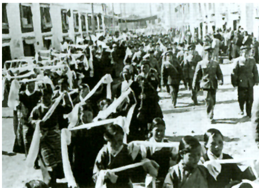
Tibetaner firar krossandet av det kontrarevolutionära kuppörsöket 1959

Så gick det för de gamla härskarna. Det tibetanska folket å andra sidan fick, liksom alla andra kinesiska folk (Kina har 56 erkända minoritetsfolk), det verkligen bättre med socialismen: skolor, sjukhus, elektricitet, vägar, järnvägar, hygien, jordreform, etc. Proletariatet och folket fick den politiska makten, folkkommuner byggdes; man förverkligade proletariatets diktatur och kom så nära kommunismen som mänskligheten, tills dags datum, någonsin kommit, med den Stora Proletära Kulturrevolutionen (1966-76).